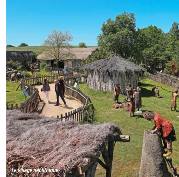
Le village néolithique

Get to know your ancestors. Discover the fabulous inventions of humans, from the first tools they carved to metalworking, and watch the evolution of hunters into gatherers and then farmers. Your journey into the past will end in a reconstruction of a Neolithic village.